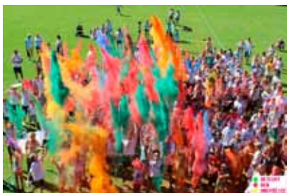
„Barevná hněvošická“ – společné foto

V sobotu 17. 6. 2017 jsme pořádali již VIII. ročník mezinárodního turnaje žáků kategorie U-11, ročníky 2006 a mladší „O pohár starosty Obce Hněvošice“. Počasí nám tentokrát neprálo, celý den byl deštivý, ale všichni kluci