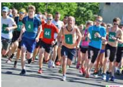
Start „Hněvošická desítka“

Počasí letos běžeckému dni přálo a odpoledního populárního závodu okolím Hněvošic „Barevná hněvošická“ se zúčastnilo více než 450 běžců. Z výrazu běžců v cíli jsme měli dobrý pocit, že závodníků vyzařovala spokojenost,